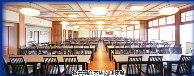
松井物産本店 / 団体席