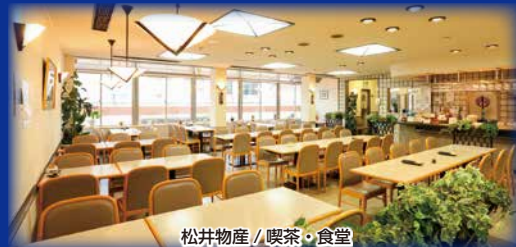
松井物産 / 喫茶・食堂